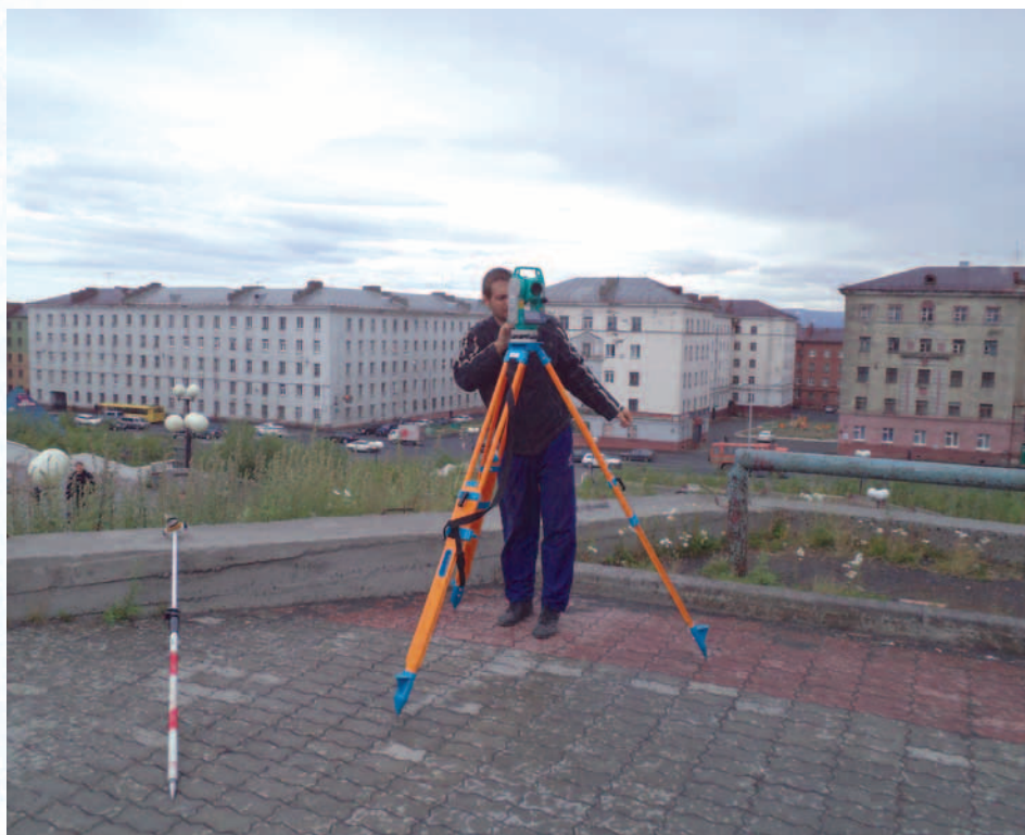
Проведение тахеометрической съемки у обелиска «Черный тюльпан»

Основная функция геоинформационной системы автомобильных дорог IndorRoad заключается в оперативном обеспечении персонала необходимыми в процессе эксплуатации сведениями, ведении и анализе данных о состоянии объектов и инженерных сооружениях на них, а также автоматическом создании выходных форм отчетности. Геоинформационная система обеспечивает возможность ввода и хранения стандартизованных описаний объектов и инженерных сооружений, анализа текущего состояния дорожных сетей, оценки эффективности работы персонала.